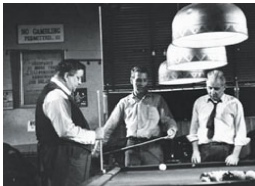
За рубежом в силу русского бильярда поначалу никто не верил