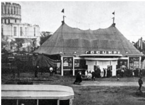
Так выглядели советские цирки-шапито в 1930-х годах

Этот деревянный цирк построили в 1933 году. Располагался он прямо на крутом спуске с горы, где стоит Крестовоздвиженская церковь.