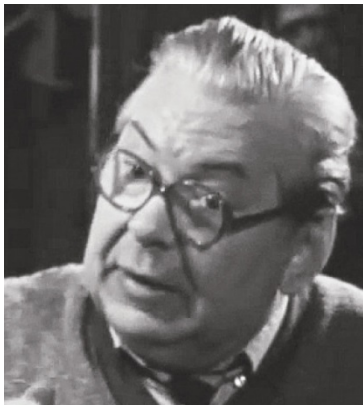
Николай Ольховиков (1922 — 1987), артист цирка, народный артист СССР. Любимец иркутской публики и всегда давал местным бильярдных

После войны настоящим украшением иркутских аккордных мероприятий стал артист цирка Николай Леонидович Ольховиков, который дважды — в 1947 и в 1971 годах гастролировал и играл в бильярд в нашем городе.